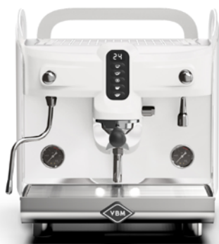
1 grupa zaparzająca

Ekspres jest dostępny w kolorze czarnym i białym, w wersjach z 1, 2 lub 3 grupami zaparzającymi.